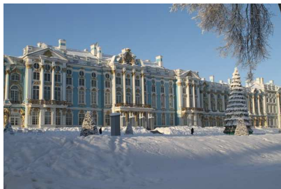
Palais de Tsarkoïe Selo, Russie