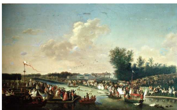
D'après Jean-Baptiste Le Paon, Bat-l'eau dans le Grand Canal, (Chantilly, musée Condé).

Descendant direct de Paul 1er, troisième fils de l'empereur Alexandre II, Vladimir Alexandrovitch Romanov est venu à Chantilly à deux reprises. Hôte du duc d'Aumale, ce prince russe était un grand veneur. C'est lui qui, voyant au château de Pavlovsk, l'œuvre de Jean-Baptiste Le Paon, Bat-l'eau dans le Grand Canal , représentant le futur Paul 1er et Maria Féodorovna lors d'une chasse à Chantilly, en fit réaliser une copie pour l'offrir au duc d'Aumale.