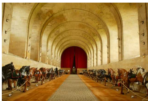
La galerie des Disciplines, Musée Vivant du Cheval de Chantilly